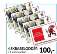
4 SKRABELODDER + 1 startstærkort 100,-

Tilmelding senest 13. november ved indbetaling på konto 9570 1350 9395 eller MobilePay 781680.