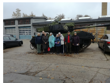
Så er 10 km. holdet klar til kamp.

Marchen var desværre ikke så velbesøgt som arrangørerne havde håbet, sikkert grundet en dårlig vejruddsig. Men vi kom næsten rundt i tørvej i en meget skøn natur, hvor vi på en del af turen, gik sammen med køerne. Bortset fra, at os der gik 10 km. "baglæns" var det en god tur. Der var oven i købet en lille rast under vejs. Der var ikke nogen holdpræmie.